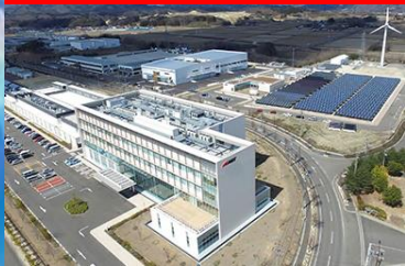
福島再生可能エネルギー研究所