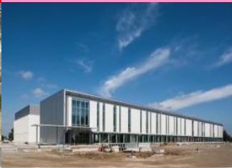
ふくしま医療機器開発支援センター