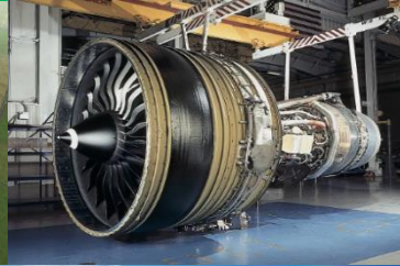
航空用エンジンの部分品・取り付け具 ・附属品出荷額全国2位 (株)IHI HPより