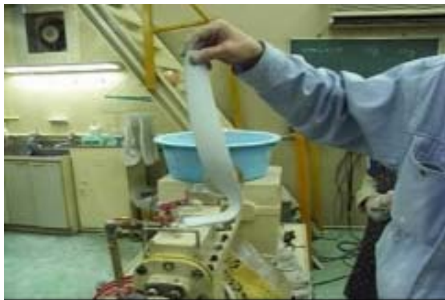
図4 押し出し直後の成型品