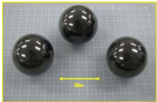
図7 大型ベアリングボール